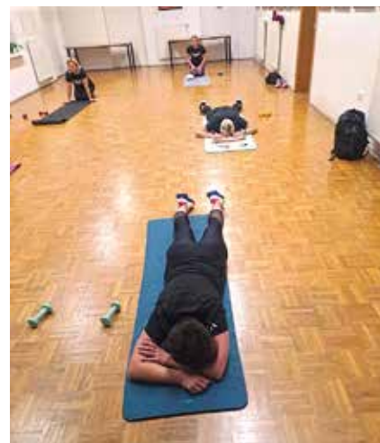
Ko te trening uniči ...