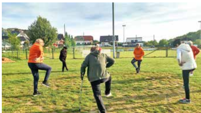
Izvajanje vaje za ravnotežje in noge