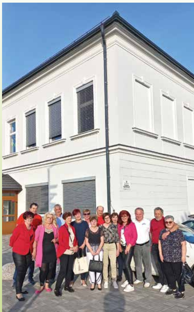
Pred osnovno šolo Dvorjane