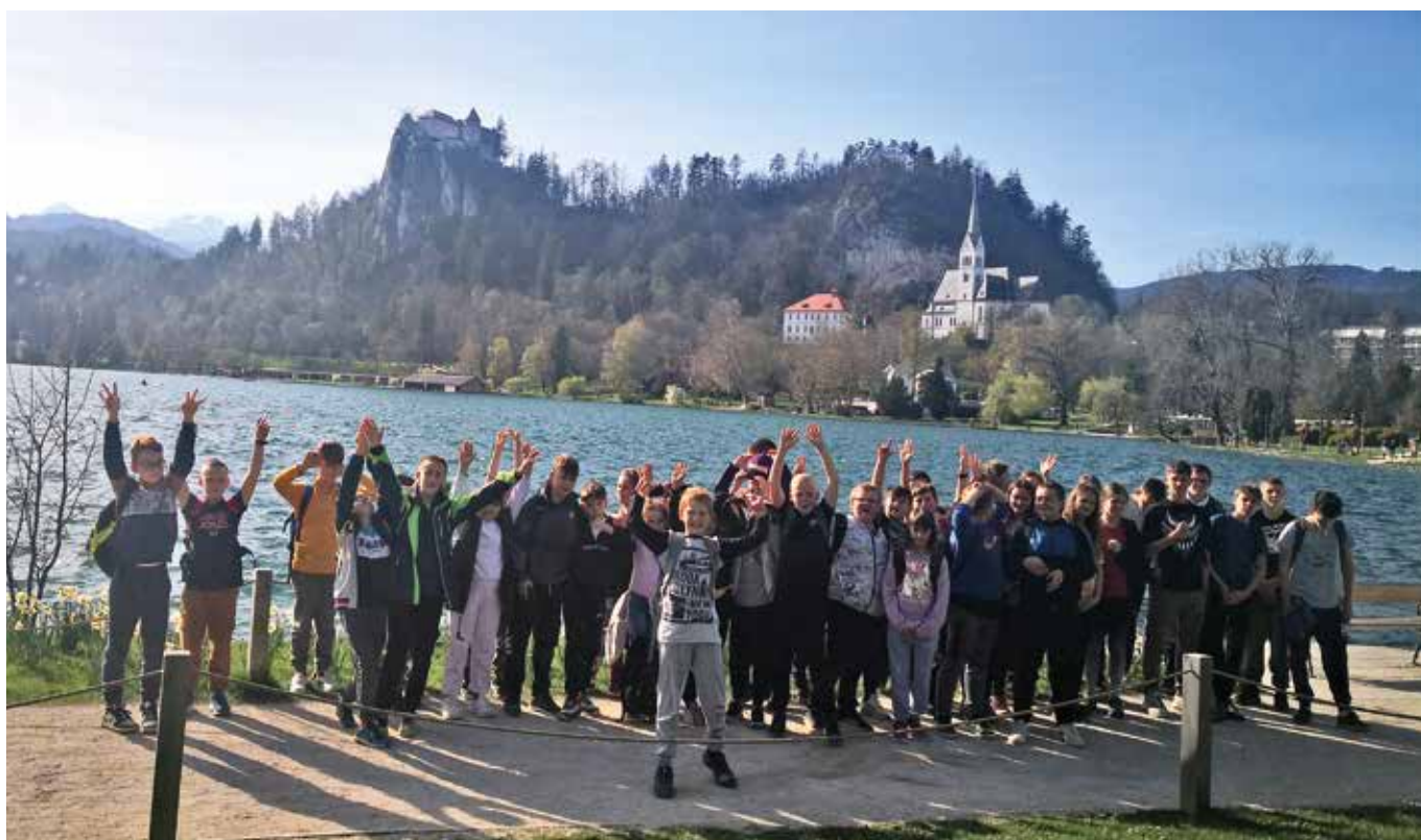
Skupinska ob Blejskem jezeru