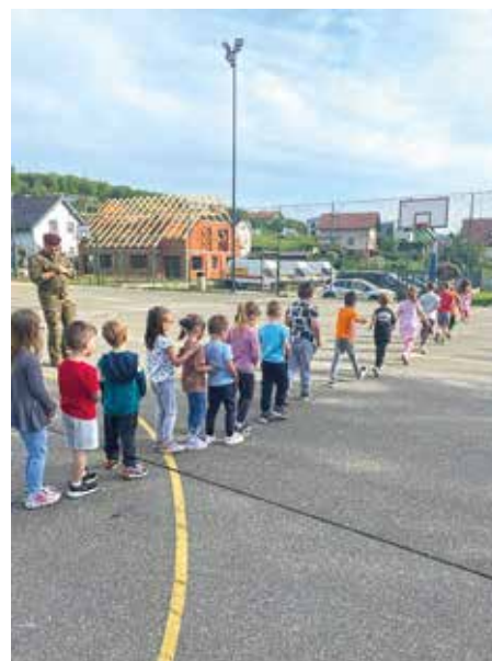
Vaje za moč