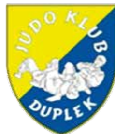
POLAGANJE PASOV 6. KYU