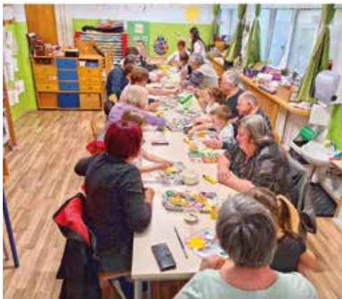
Izdelovanje pomladnih venčkov