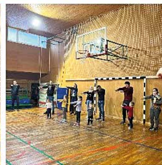
Gibalne dejavnosti v telovadnici