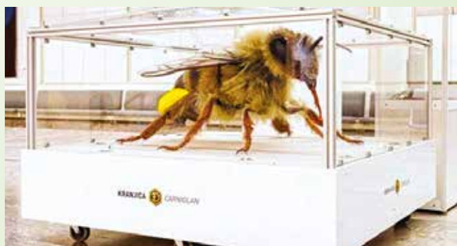
Kranjska čebela velikanka