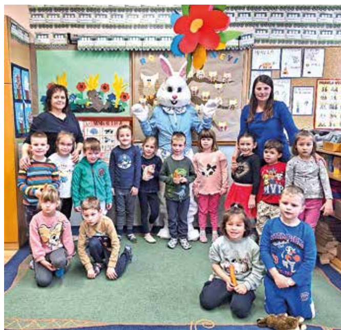
Skupinske fotografije otrok z velikonočnim zajčkom