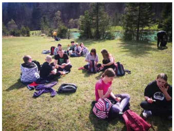
Piknik ob jezeru Kreda

V petek, ko se je začel pouk, smo se odpravili v Mojstrano. Na avtobusu smo si krajšali čas z igro. Najbolj mi je bilo všeč, ko smo si podajali letala. Ko smo prispeli, smo imeli malico. Potem smo si z učenci Osnovne šole Mojstrana ogledali kraj in njegove znamenitosti. Najprej smo se sprehodili po kraju, potem pa smo šli v muzej. Tam smo si ogledali film, potem pa smo šli pogledat v drugo nadstropje, kako se sliši grmenje, ko spiš v bivaku, in kako izgledajo nagačene živali ter stara orodja za plezanje. Dobili smo vsak svoj magnet za spomin. Odpravili smo se na jezero Kreda in tam imeli piknik. Jedli smo kruh, zaseko in klobaso.