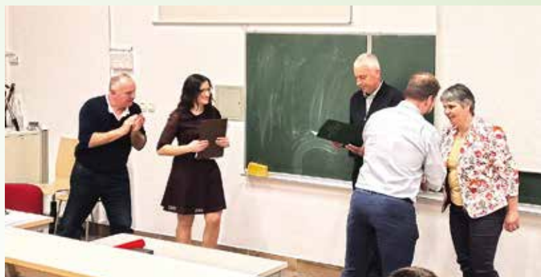
Podelitev priznanja na Biotehnični fakulteti v Ljubljani

nost in pripravljenost pomagati sta zgled, ki ga cenimo in spoštujemo.