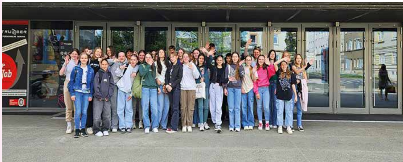
Učenci od 7. do 9. razreda smo se odpravili v kino, kjer smo si za nagrado ogledali čudovit film.