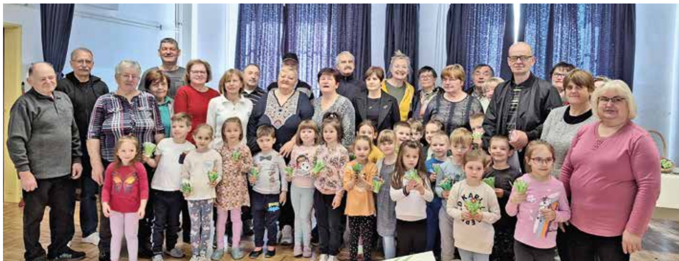
Skupna fotografija otrok s starimi starši