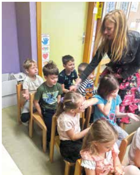
Z namišljenim vlakcem smo se odpeljali v podzemno jamo.