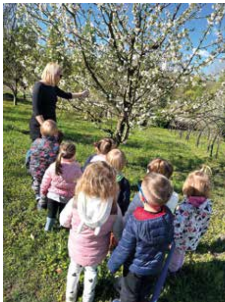
Cvetoče češnjevo drevo v aprilu in drevo s češnjevimimi plodovi v maju