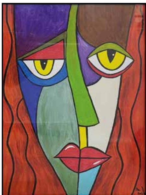
Slika Marija Jančič OBRAZ 40x30