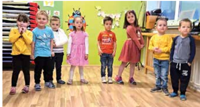
Nastop otrok na spomladanski prireditvi za starše