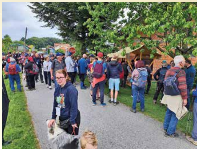
Na kontrolnih točkah pohoda je vedno živahno

ne strani 462 m visoke Grmade, najvišjega vrha Slovenskih goric, kjer so udeleženci prejeli tretji kontrolni žig in osvežilno vodo, da smo pot lahko nadaljevali po zahodnem pobočju Grmade proti gradu Vurberk, kjer smo zaključili pohod z zadnjim kontrolnim žigom, prejeli spominsko kapo pohoda ter bon za toplo malico.