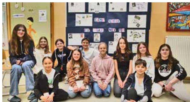
Izjemni učenci so v dveh dneh skoraj celotni centralni šoli predstavili življenja izjemnih Slovenk, ki so utirale nove poti.

Vsak si je lahko že mesec pred predstavitvijo izbral žensko, ki se mu je zdela najbolj zanimiva. Izbrala sem si prvo slovensko zdravnico. Tisti, ki so predstavitev imeli že prvo uro, so se dobili v jedilnici pri učiteljici, ostali pa so odšli k pouku. Predstavitev sem začela že prvo uro s 6.b razredom. Tam sem jim razložila, da jim bom predstavila Eleonoro Jenko Groyer, nato pa sem jim postavila tri vprašanja.