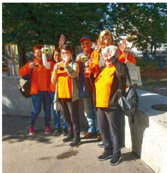
Druženje pri Fontani v Žalcu