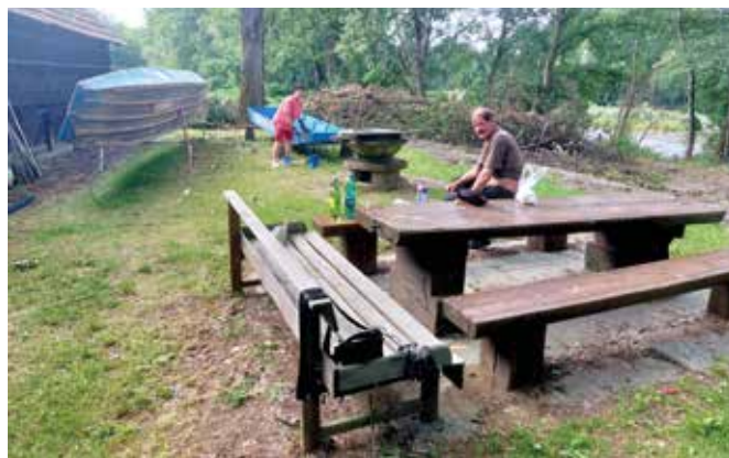
Gospodar z ženo med obnovo

preostalih bomo nadaljevali letos. Leta 2022 smo sodelovali z občino Starše v igri pridobivanja zlata iz reke Drave in izvedli kar nekaj spustov po reki, med njimi smo gostili tudi Gasilsko zvezo Slovenije.