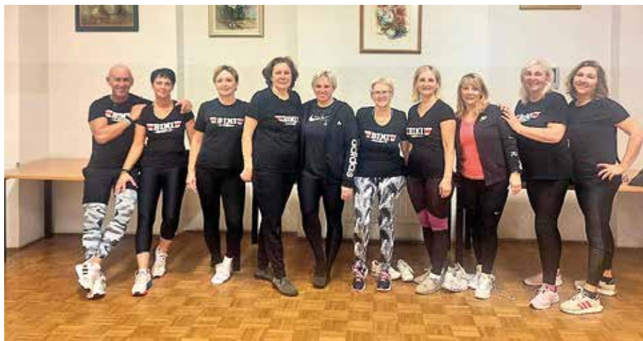
Ekipe punc Bini fitk po treningu