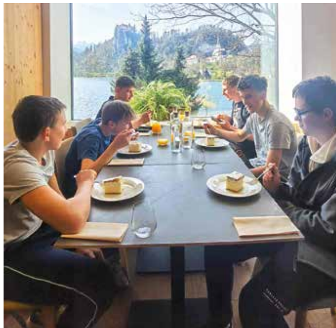
Kremšnite v Hotelu Park Bled