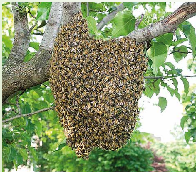
Roj čebel

Primer spreminjanja biodiverzitete na dvorišču Mestne občine Maribor, kjer se izvaja kasnejša košnja.