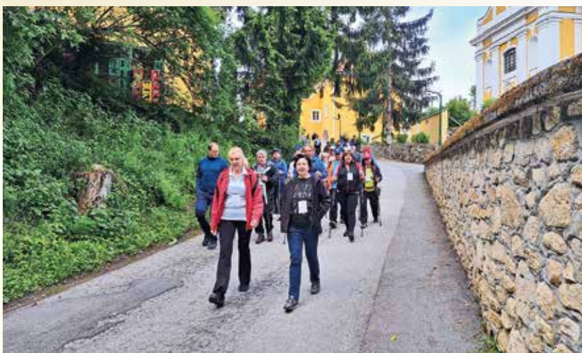
Več kot 300 udeležencev se je skupaj podalo na 19. pohod na Grmado

V skladu s tradicijo in lepimi doživetji iz preteklih let smo se člani Turističnega društva Vurberk zbrali že takoj po 7. uri zjutraj in na prostoru za piknik na gradu Vurberk pripravili vse potrebno za evidentiranje udeležencev pri stojnicah in dobro voljo z glasbeno podlago iz ozvočenja, ki so nam ga tudi tokrat zagotovili predstavniki režijskega obrata Občine Duplek, ki nam vsa leta stoji ob strani pri naših aktivnostih. Udeleženci so kaj hitro pričeli prihajati v lepem prvomajskem jutru in ob 9. uri smo