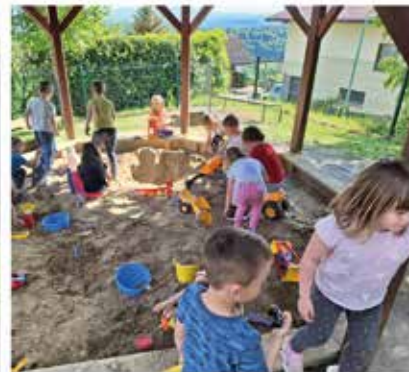
Popoldansko preživljanje časa v vrtcu