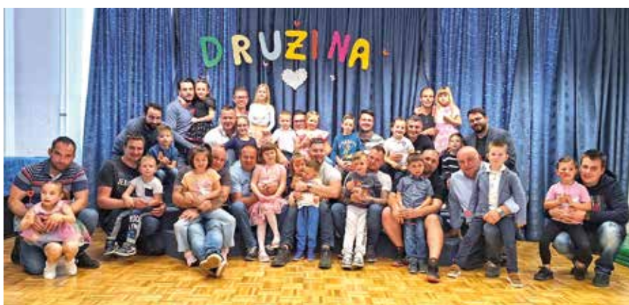
Skupinski fotografiji otrok s starši