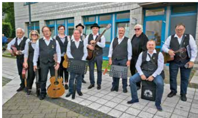
Dvorjanski muzikanti pred nastopom v občinski zgradbi

Polni vtisov in novih doživetij smo se odpravili proti domu. Lepe želje, stiski rok in številne zahvale so poskrbeli za prijeten zaključek potovanja. Tovrstni obiski namreč pomembno prispevajo k utrjevanju medsebojnih vezi in spodbujajo sodelovanje na različnih področjih. Komaj že čakamo, da se ponovno snidemo.