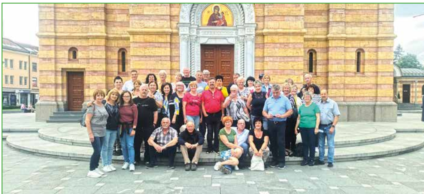
Izlet Turističnega društva občine Duplek v Banja Luko