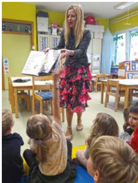
Pisateljica Breda Mulec pripoveduje.