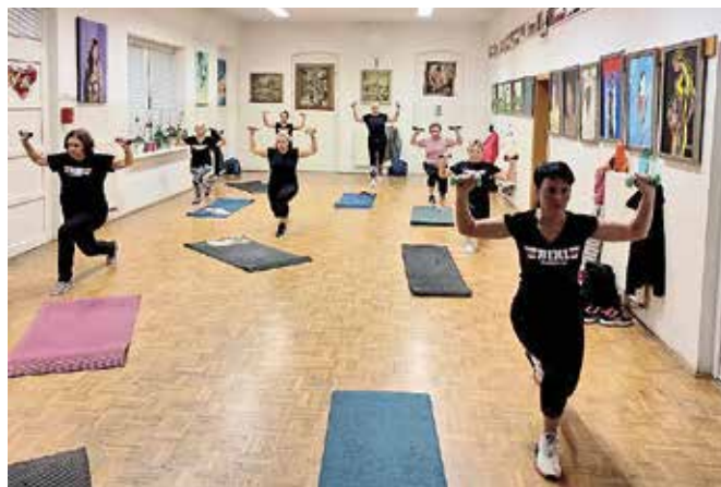
Vaje za moč

Zame so vsi ljudje enaki, te stvari me niso nikoli definirale niti me ne bodo. Oprostiš tudi vedno, že zaradi sebe. Ker je svet lep, saj najdeš lepoto v majhnih stvareh. To, da želiš postati najboljša različica sebe, ne pomeni, da