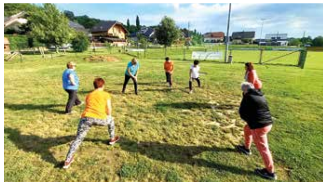
Izvajanje vaje izpadni korak