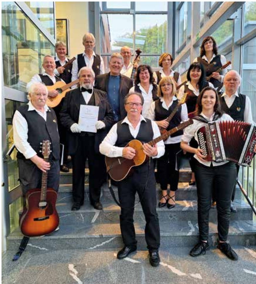
Ena skupinska pred nastopom