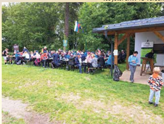
Po zaključku pohoda je topla malica mesarije Blatnik nedvse prijala.