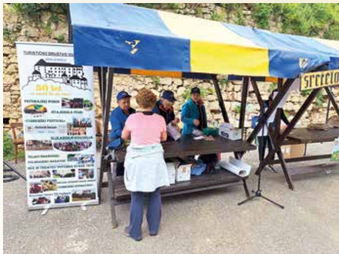
Srečelov po pohodu je dvignil razpoloženje ob mnogih drobnih presenečenjih

imeli evidentiranih skoraj 280 pohodnikov, ki so prejeli kartončke za evidentiranje na kontrolnih točkah pohoda. Pohodniki so se okrepčali s prvo jutranjo kavico, ki so jo postregle naše članice.