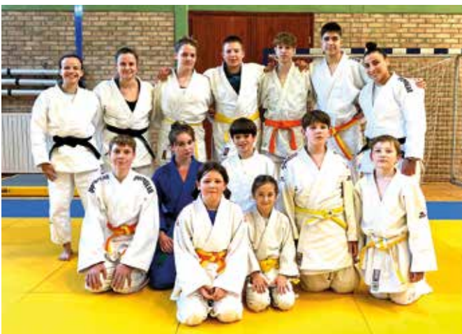
JUDO CAMP TERME OLIMIA 2024