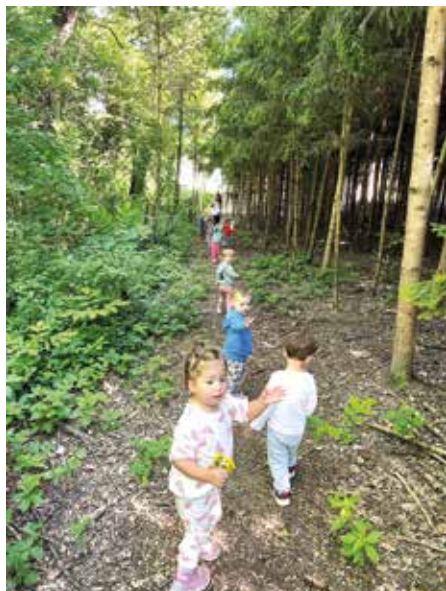
Sprehod po gozdičku ob reki Dravi