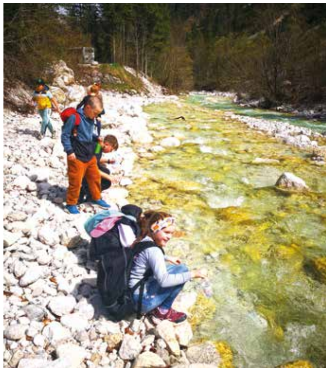
Ob Triglavski Bistrici