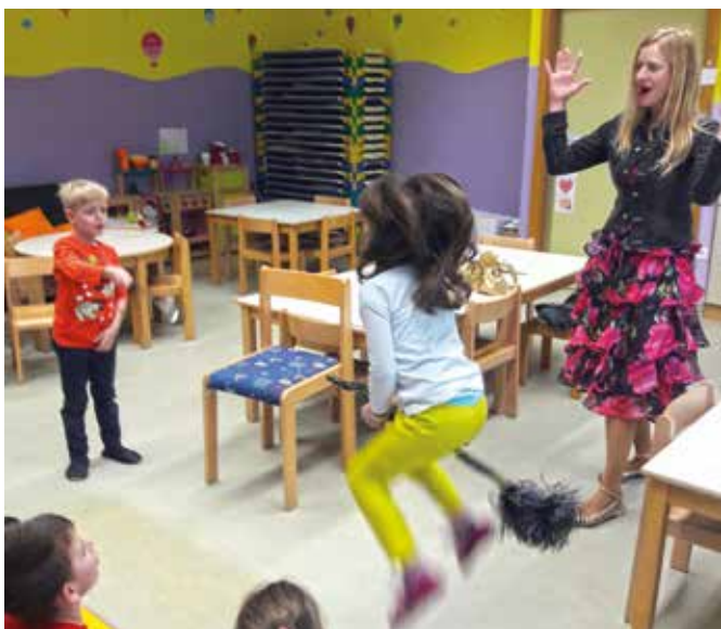
Smo čarali in leteli na čarovniški metli.