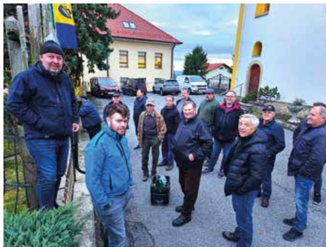
Rezanje potomke Stare trte pri cerkvi Sveta Barbara v Koreni

Kot vsako društvo smo tudi v društvu Trta imeli občni zbor, na katerem smo pregledali, kaj smo naredili v preteklem letu, katerih dogodkov smo se udeležili. Podali smo tudi načrt za leto 2024, ki je zelo pester; udeležili se bomo številnih dogodkov, prav tako nas čaka veliko de-