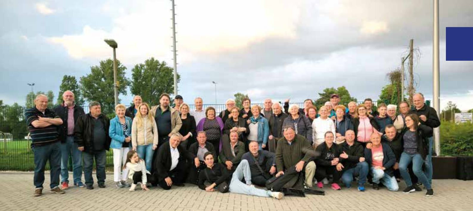
Skupinska slika delegacije Dupleka in Dormagna pred nogometnim igriščem