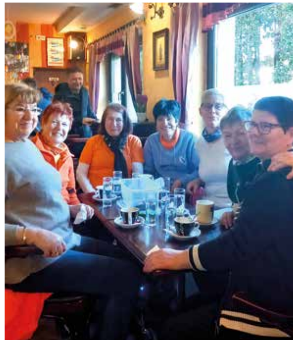
Super dame – druženje izven vadbenih površin – skupna jutranja kavica

Tebe, draga bralka, dragi bralec, pa prijazno vabimo medse. Če te je vsebina nagovorila in si začutil/a, da je čas za rekreacijo, prilagojeno tebi, kjer se boš sprostil/a, se naučil/a novih stvari in se veselil/a skupaj z nami, je sedaj čas, da se nam pridružiš. Že-