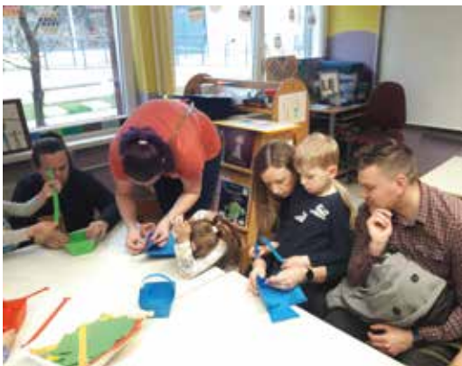
Utrinki iz srečanja

kov in obredov. Pri nas v vrtcu se spomnimo na 8. marec – dan žena, 10. marec – štirideset mučenikov, 19.–22. marec – začetek koledarske pomladi in 25. marec – materinski dan. Materinski dan nas spomni na naše mame