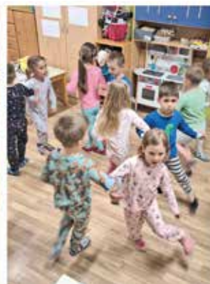
Zvečer smo iskali skriti zaklad, pripravili pižama party in kino.