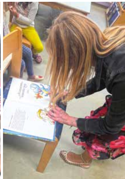
Dobili smo knjigo s podpisom.