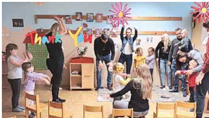
Ples otrok in staršev