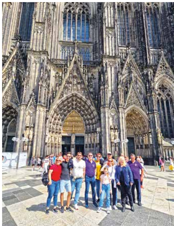
Pred katedralo v Kölnu