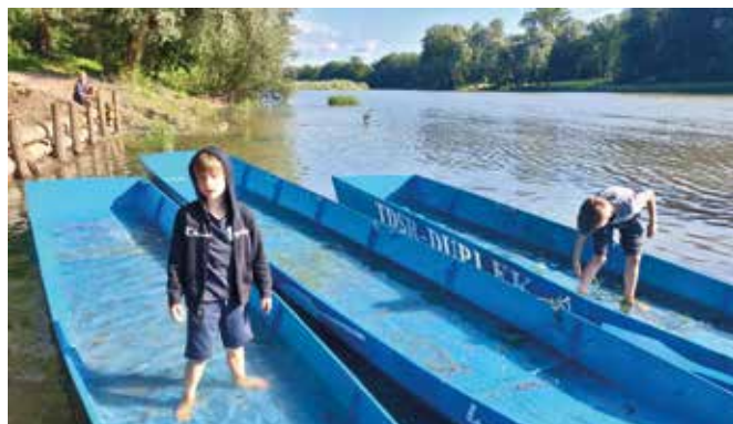
Društvu pomaga tudi mlada generacija.

prilaga 22. junija 2024 spust po Dravi, in sicer od Malečnika do Zgornjega Dupleka. Vabljeni vsi, ki bi želeli sodelovati. Za prijavo, prosimo, kličite ali pišite na 031 526 122 (Štefan) ali 031 708 222 (Mojca).